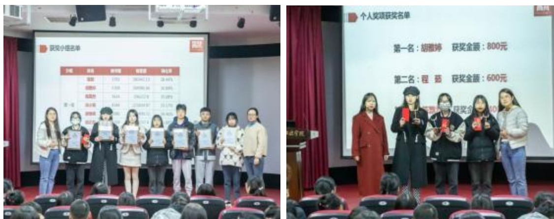
图7 校企共同进行实训总结表彰

最后，合作企业在校建有校内实训基地，校方提供桌椅、电脑、网络、电脑等基础设备设施，企业进行标语、海报、墙纸等企业文化元素布置。