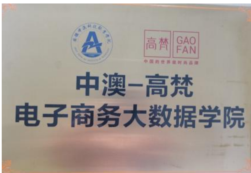
图3 中澳·高梵电子商务大数据学院挂牌

安徽高梵电子商务有限公司主要与中澳电子商务和市场营销专业开展校企合作。2017年8月，安徽高梵电子商务有限公司与中澳学院合作成立中澳·高梵电子商务大数据学院。2023年12月，安徽高梵电子商务有限公司等7家企业与中澳学院合作成立智汇云商产业学院。中澳学院电子商务专业是省级高水平高职、省级特色专业、省级示范实训中心、省级实践教育基地等。2020年，安徽高梵电子商务有限公司获批为安徽省第三批校企合作示范基地。