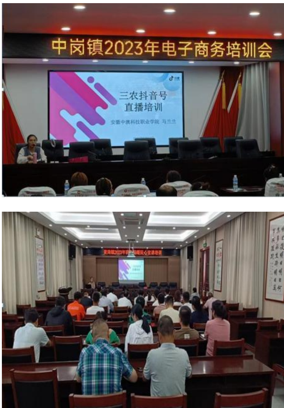
图14 电商教师在为农村电商人员开展培训

农业经营主体、电商网点负责人等。培训内容以三农抖音直播为主，围绕直播电商平台普及、直播选品话术、直播后台操作、电子商务法等方面进行全方面教学，累计培训人数达1161人。