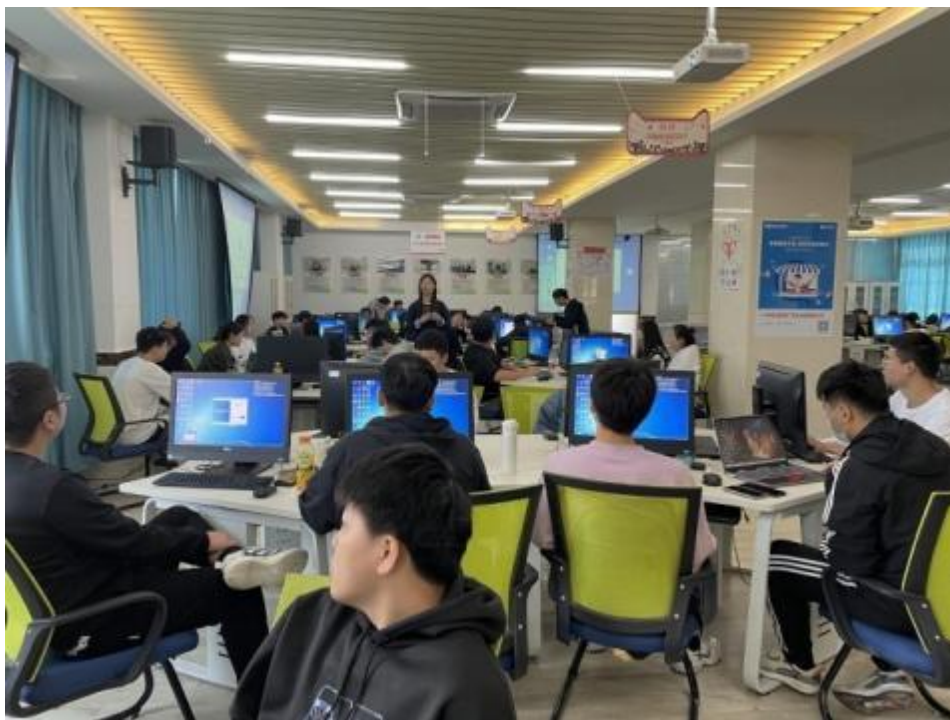
图11 校企合作开展学生实训活动

训》《双十一实训月》等实践课程，实施企业进校园项目化教学，让学生分组完成电子商务典型工作，如店铺运营、店铺装修设计、网络编辑、网络推广和网络客服等。