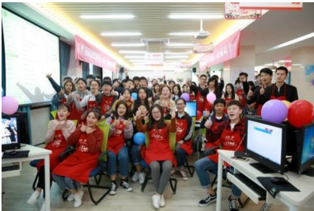
图6 高梵“双十一”实训月动员

划、实训学生安排等事宜。双十一实训课程为专业核心课程，实训前均已完成相关课程的理论学习，比如客服技巧、物流管理、网络营销等课程。