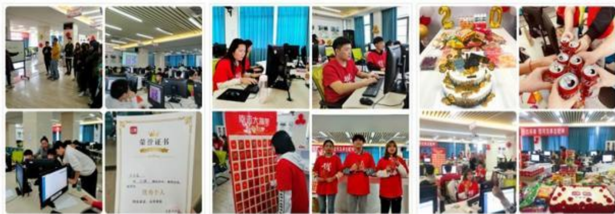
图8 “双十一”实训月全过程

双十一实训不仅是课程，更是直接为企业创造经济效益，是真实的商业战场，学生实训的效果如何也关系到企业的销售状况。双十一实训将企业生产跟学校专业岗位群对应的客服岗位纳进学校，类似于将工厂中的一个车间搬进了校园中，实现了“工作驱动、学做合一”的人才培养模式。这是一种便捷高效的校企合作方式。学生能够经历到任何模拟实训无法比拟的工作体验，同时为企业解决高峰时期人力短缺的问题，创造经济价值。