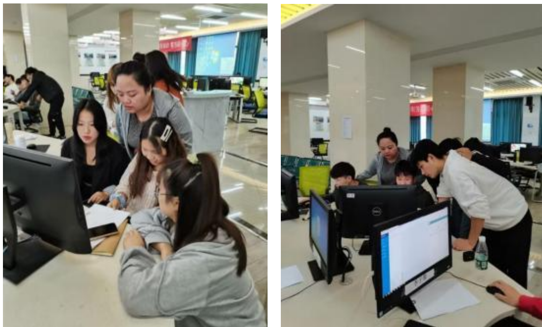
图12 高梵技术人员指导学生实训