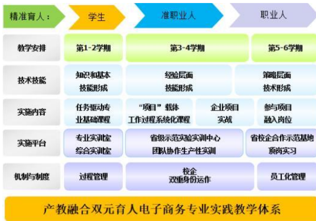
图10 电子商务专业产教融合双元育人实践教学体系

为将来走上其它电商岗位打下了扎实的基础。为其一个月的实训学生为高梵公司也产生了经济效益，达到校企共赢的效果。