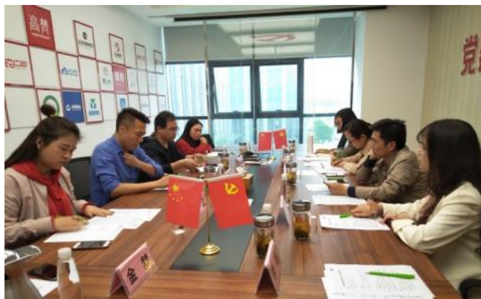
图2 双方洽谈校企合作