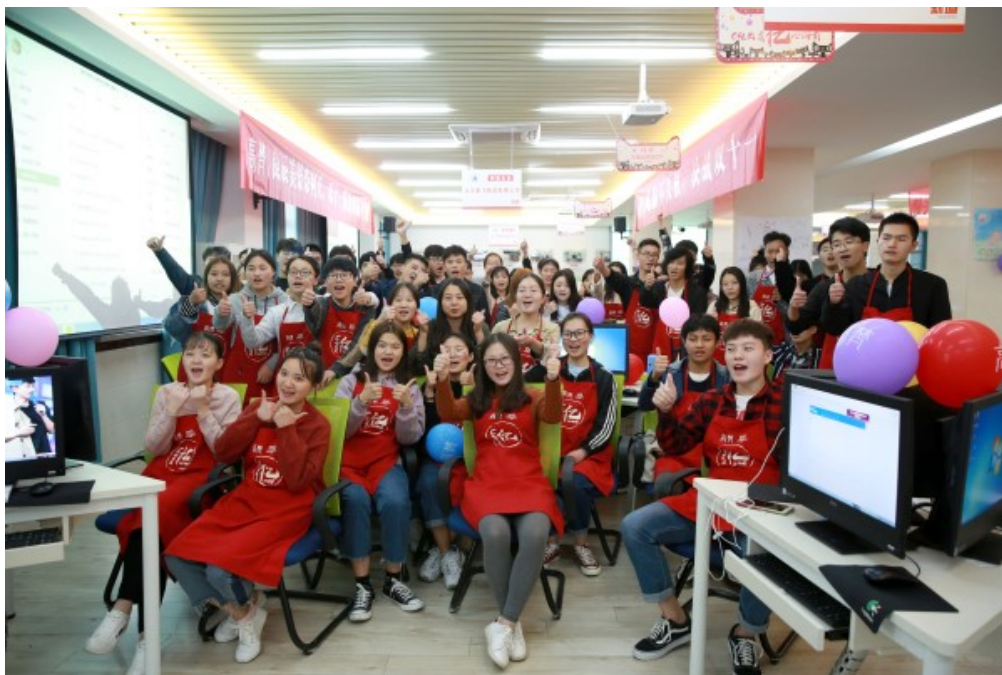
图6 高梵“双十一”实训月动员

划、实训学生安排等事宜。双十一实训课程为专业核心课程，实训前均已完成相关课程的理论学习，比如客服技巧、物流管理、网络营销等课程。