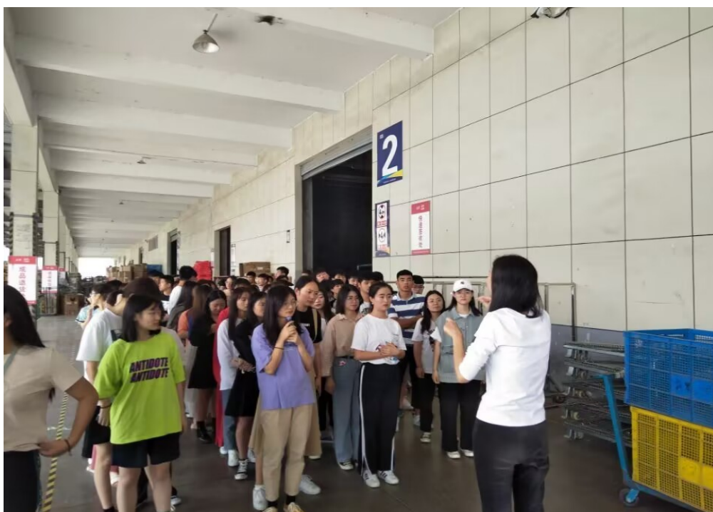
图 5 中澳学院组织学生赴高梵参观考察