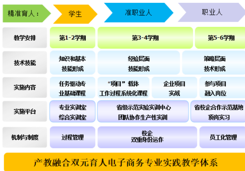
图10 电子商务专业产教融合双元育人实践教学体系

为将来走上其它电商岗位打下了扎实的基础。为其一个月的实训学生为高梵公司也产生了经济效益，达到校企共赢的效果。