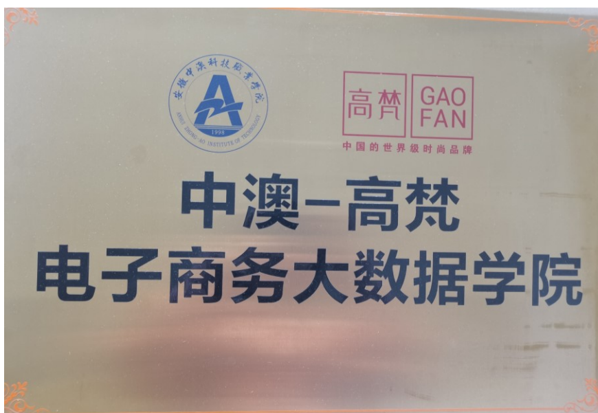
图3 中澳·高梵电子商务大数据学院挂牌

安徽高梵电子商务有限公司主要与中澳电子商务和市场营销专业开展校企合作。2017年8月，安徽高梵电子商务有限公司与中澳学院合作成立中澳·高梵电子商务大数据学院。2023年12月，安徽高梵电子商务有限公司等7家企业与中澳学院合作成立智汇云商产业学院。中澳学院电子商务专业是省级高水平高职、省级特色专业、省级示范实训中心、省级实践教育基地等。2020年，安徽高梵电子商务有限公司获批为安徽省第三批校企合作示范基地。