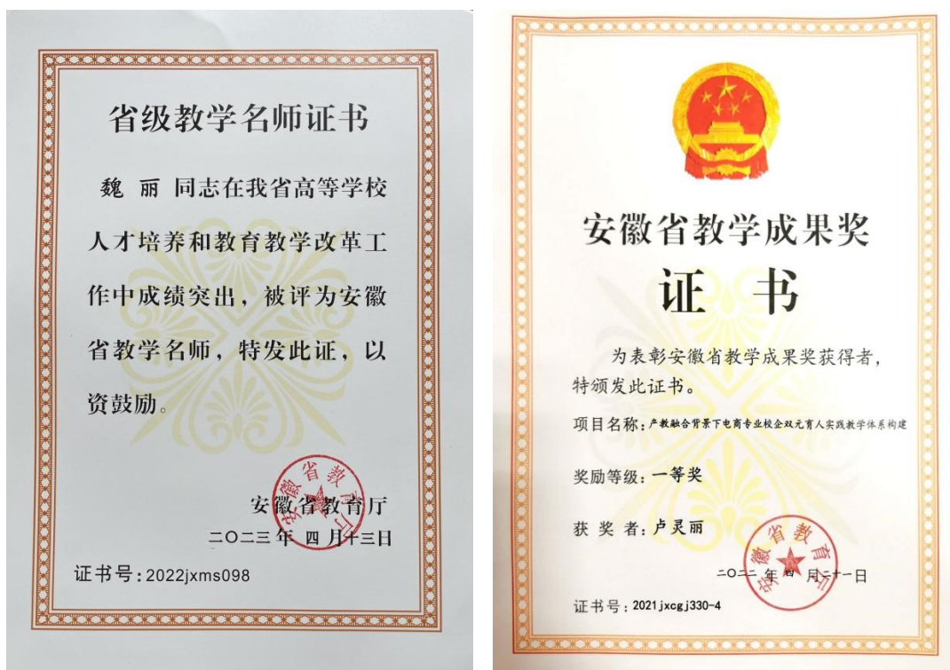
图 1 教师与团队取得的部分荣誉

电子商务专业群拥有师资团队 13 人，其中校内专职教师 8 人，以中青年为主，教授 1 人、副教授 1 人，高级职称占比 25%，讲师 4 人，助教 2 人，分别占比 50%和 25%；全部拥有硕士学位。固定外校兼职教师有 2 人，均为中级职称；安徽高梵电子商务有限公司固定兼职教师 3 人，参与教育教学、指导学生实习、实践等，其中一名高管被中澳学院聘请为“产业导师”。