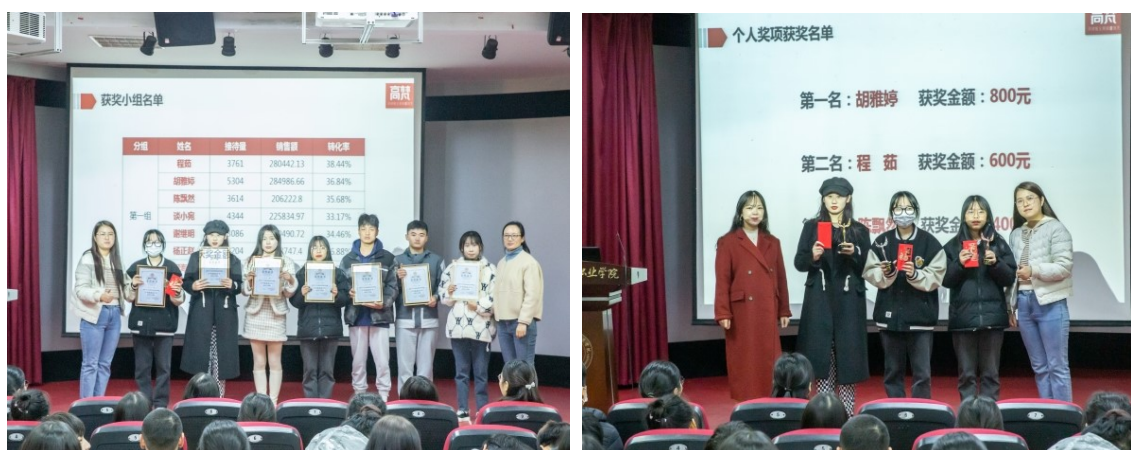
图7 校企共同进行实训总结表彰

最后，合作企业在校建有校内实训基地，校方提供桌椅、电脑、网络、电脑等基础设备设施，企业进行标语、海报、墙纸等企业文化元素布置。