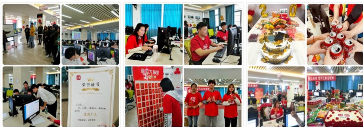
图8 “双十一”实训月全过程

双十一实训不仅是课程，更是直接为企业创造经济效益，是真实的商业战场，学生实训的效果如何也关系到企业的销售状况。双十一实训将企业生产跟学校专业岗位群对应的客服岗位纳进学校，类似于将工厂中的一个车间搬进了校园中，实现了“工作驱动、学做合一”的人才培养模式。这是一种便捷高效的校企合作方式。学生能够经历到任何模拟实训无法比拟的工作体验，同时为企业解决高峰时期人力短缺的问题，创造经济价值。