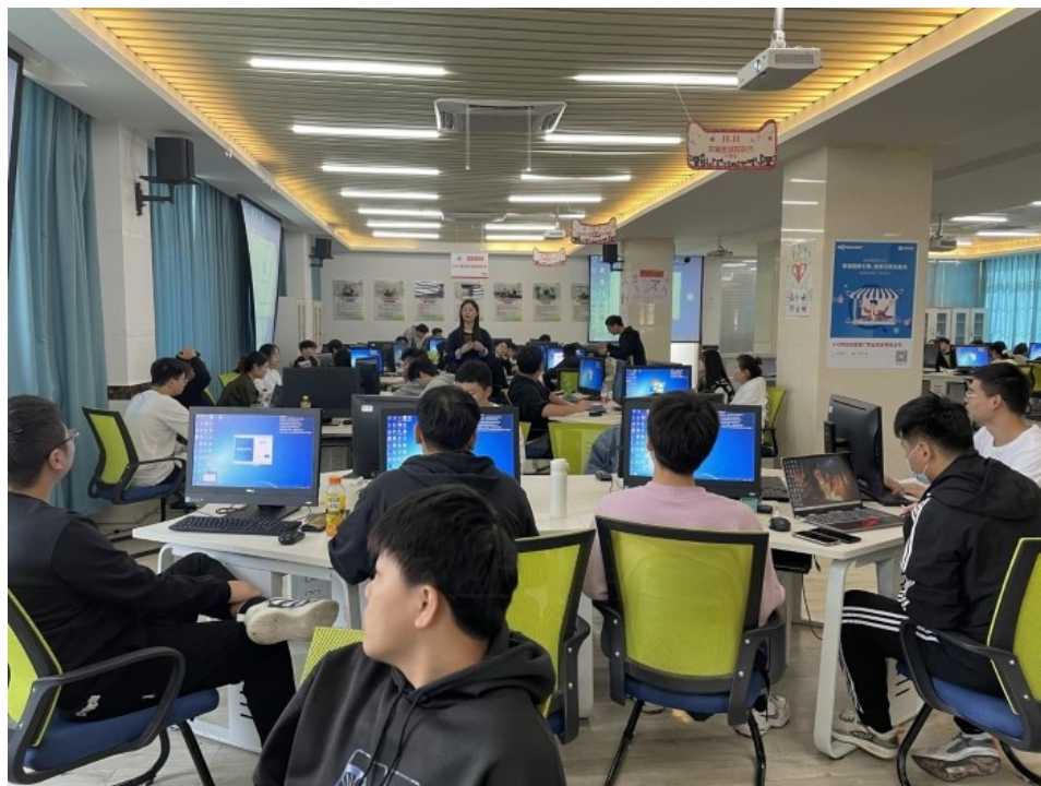
图11 校企合作开展学生实训活动

训》《双十一实训月》等实践课程，实施企业进校园项目化教学，让学生分组完成电子商务典型工作，如店铺运营、店铺装修设计、网络编辑、网络推广和网络客服等。