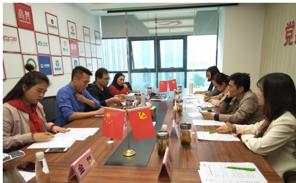
图2 双方洽谈校企合作