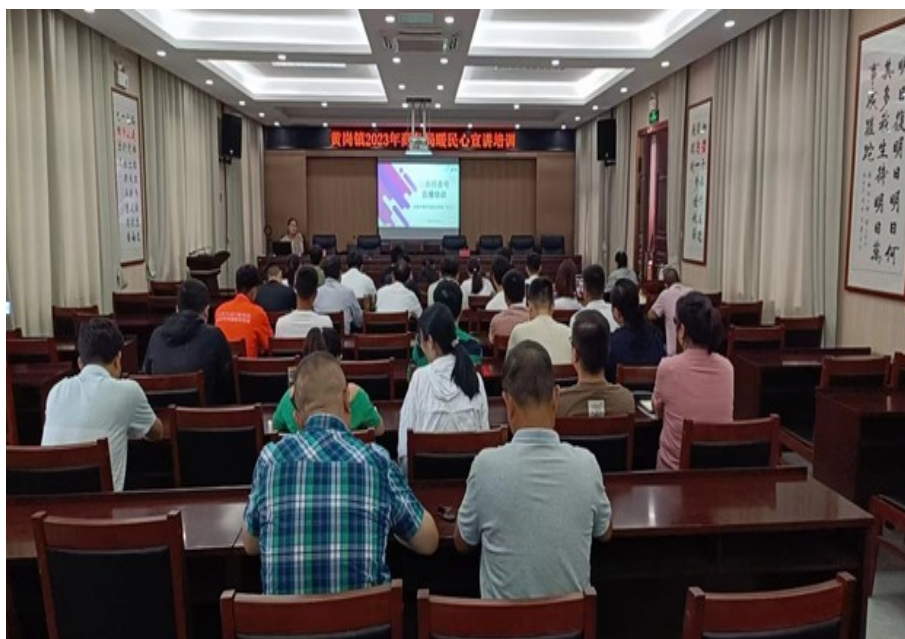
图14 电商教师在为农村电商人员开展培训